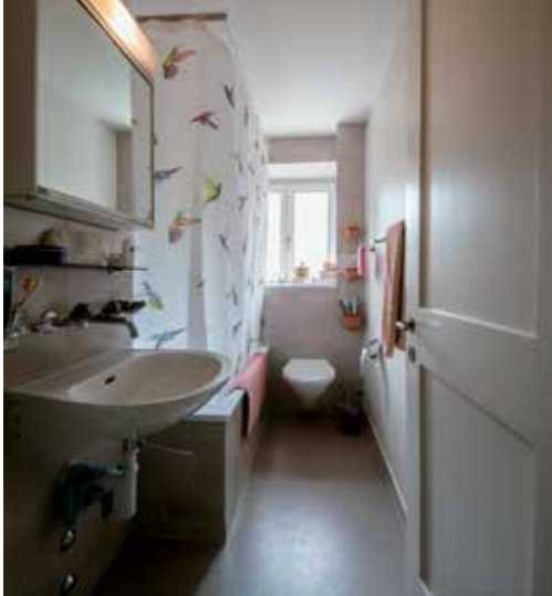
Bad im früheren Zustand ...