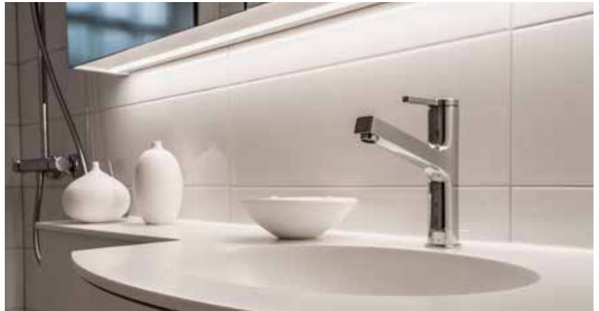
... und in heutiger Optik.

trotz Sanierungsarbeiten möglichst hoch zu halten, wurden ein Wasserzugang auf jeder Etage sichergestellt und Duschen und Toilettenanlagen im Keller installiert. Somit bleiben die Wohnungen während der ganzen Arbeiten bewohnbar.