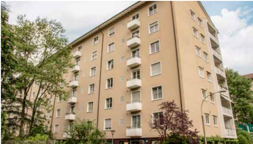
Die Siedlungen der Wohngenossenschaft Kannenfeld stammen aus der Nachkriegszeit.