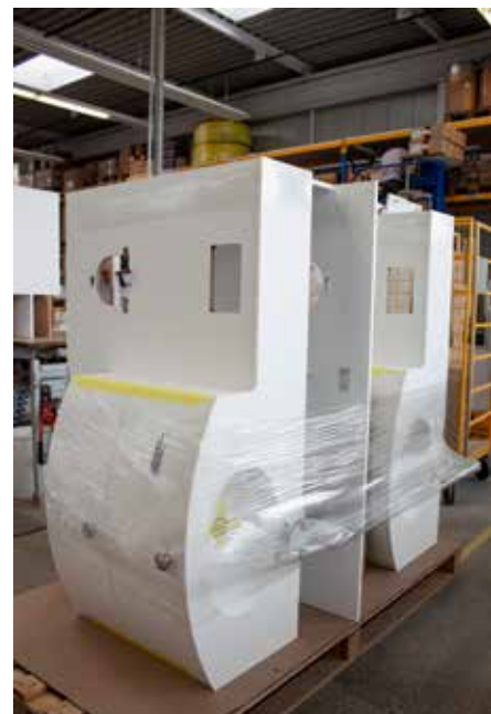
Vorwand und Möbel werden im Werk bereitgestellt, auf die Baustelle geliefert und dort montiert (im Uhrzeigersinn von links). Innert zehn Arbeitstagen können so 24 Bäder erneuert werden.

2015. Auch ein zweites Projekt wurde am 5. November 2015 an den Vorstand zurückgewiesen. Daraufhin gründete man eine Arbeitsgruppe, die zusammen mit dem Architekturbüro Flubacher Nyfeler Partner die Grundlagen für ein Vorprojekt entwickelte. Auch die Mieterschaft wurde in diesen Prozess miteinbezogen, indem sie aufgefordert wurde, zur Thematik «Dusche oder Badwanne?» Stellung zu nehmen. Der Rücklauf sei erfreulich gewesen, seien doch rund zwei Drittel der Anfrage nachgekommen.