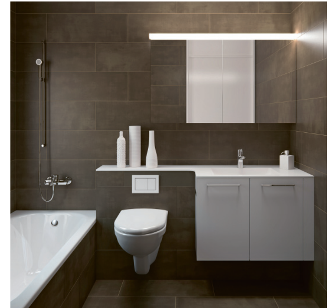
Sanieren schnell und leichtgemacht – dank des bewährten Vorwandsystems «vitessa» von Talsee.

Bestellen Sie noch heute kostenlos den Bad- und/ oder Spiegelschrank-Katalog von talsee unter der Telefonnummer 041 914 59 59 oder unter www.talsee.ch .