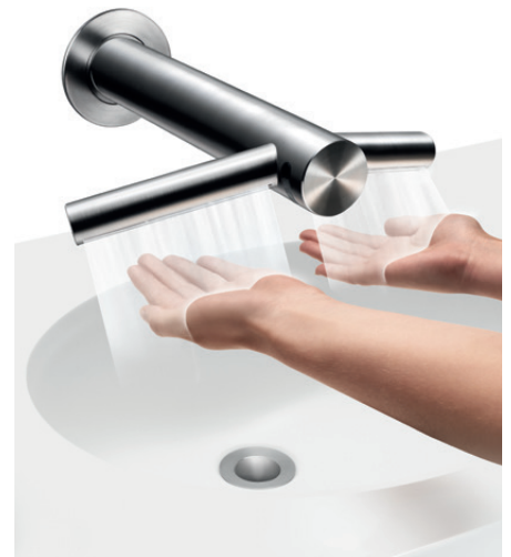
dyson airblade tap

Die talsee Waschtische können mit dem Dyson Airblade™ Tap ausgestattet werden. Die Technik wird bei talsee komplett in den Waschtisch integriert, wodurch dieser auf der Baustelle nur noch montiert und an Wasser und Strom angeschlossen werden muss.